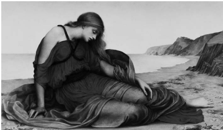
Ariadne in Naxos - Evelyn De Morgan, 1877

Strauss et Hofmannsthal durent complètement repenser leur projet et la version définitive, créée à Vienne le 4 octobre 1916 , offre un visage très différent. Ce qui n'était à l'origine qu'une façon de s'exercer à l'art de concevoir